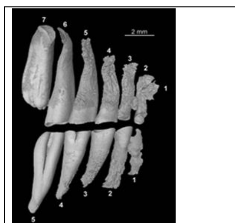
Reconstructions 3D par micro-tomographie à rayonnement synchrotron (ESRF, Grenoble) des rangées dentaires inférieures et supérieures du rat-taupe argenté en vue latérale.